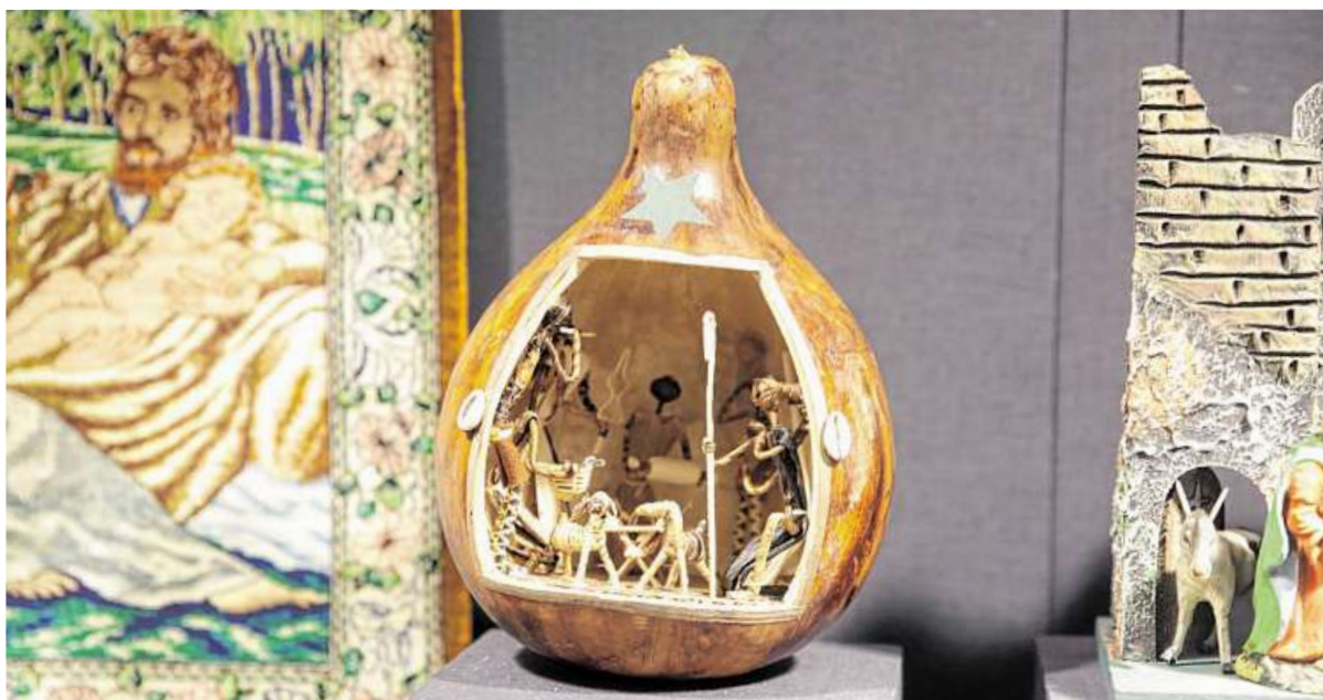
Im Dom sind Krippe aus aller Welt zu sehen: eine Krippe aus Peru in einer Kalbasse (links) sowie Krippen im Ei aus Peru, Krippe mit Jesuskind in der Wiege aus dem bayerischen Raum und eine farbenfrohe Miniatur-Krippe, auf einem Leuchter platziert.

Die Krippen-Ausstellung im St.-Petri-Dom und im Dom-Museum ist bis zum Dreikönigstag, dem 6. Januar, zu sehen. Wochentags ist die Ausstellung von 10 bis 16.30 Uhr geöffnet, an den Wochenenden nicht. Geschlossen ist das Museum außerdem über die Weihnachtsfeiertage bis einschließlich 27. Dezember. Ein kurzer Telefonanruf vor dem Besuch ist zu empfehlen. Im Dom-Museum selbst gilt die 2G-Regel.