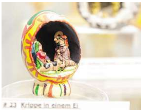
7.23 Krippe in einem Ei