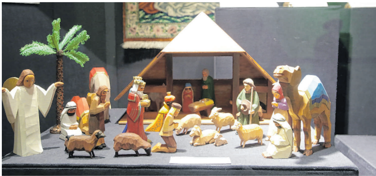
In der Krippenausstellung gibt es immer etwas Neues zu entdecken, denn der Dom erhält Jahr für Jahr neue Schenkungen für seine Sammlung.

Die größte Vielfalt an Krippen-Spielarten kommen aus dem südamerikanischen Peru. Dort werden winzige Versionen der Heiligen Familie samt Hirten und Heiligen Drei Königen in kleine, geschnitzte, fantasievoll dekorierte Kalebassen, also Kürbisse, in bunt be-