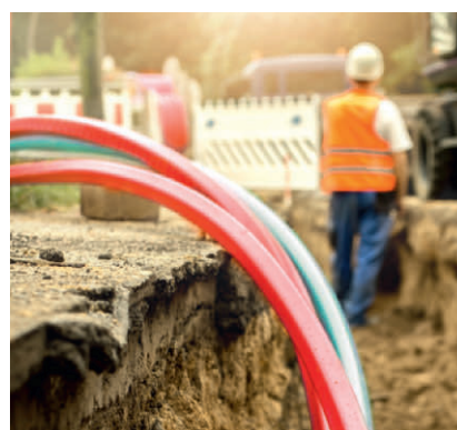
Moderne Glasfaserleitungen werden verlegt.

So einfach kommt Glasfaser zu Ihnen. Dank swb und Glasfaser Nordwest wird bald vielen Haushalten und Unternehmen in Bremen 1 ein direkter Anschluss ans Glasfasernetz ermöglicht – eine zeitgemäße Wertsteigerung für jedes Zuhause bzw. Unternehmen. Und das, indem Sie ab dem 7. Januar 2025 ein attraktives swb Glasfaser-Paket mit einem Glasfaseranschluss für 0€ beauftragen 2 .