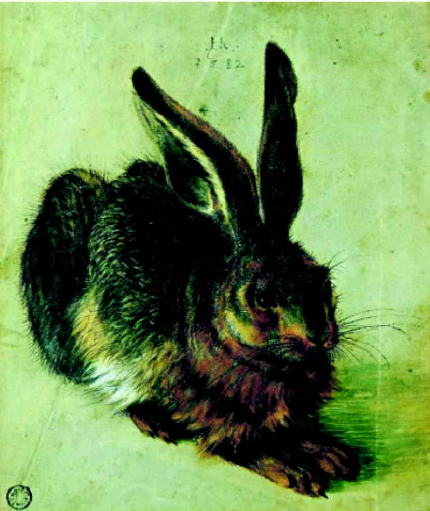
Hans Hoffmanns „Feldhase“ ist jetzt in Köln versteigert worden.