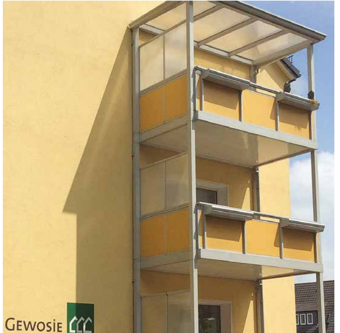
Die Gewosie gönnt ihren GenossInnen Balkone, für die sie das anderthalbfache des Marktpreises zahlt

Genauer war der Auftrag nicht gefasst – offensichtlich hatte der Geschäftsführer der Gewosie Vertrauen zu seinem Aufsichtsratsvorsitzenden. Die Gill-Bau überprüfte und fand bei allen Häusern einen vergleichbaren Aufwand: Material auf den Dachboden bringen, Ge-