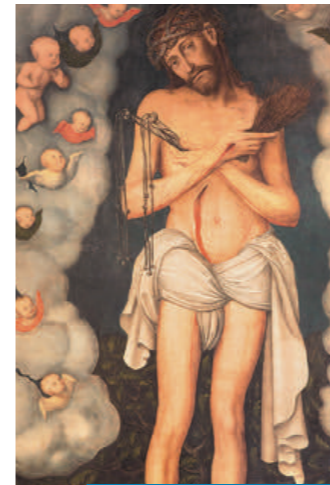
04. Der Schmerzensmann

Durch die Kinderecke mit Maltisch und Textilproben für unsere jüngeren Gäste betreten Sie nun den Neubau. Hier