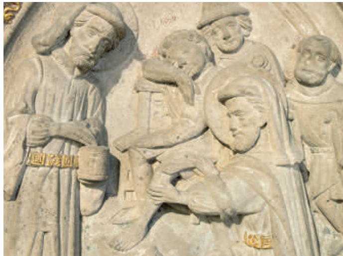
01. Relief der Heiligen Cosmas und Damian

Von der über 1200-jährigen Geschichte des St. Petri Doms zeugen auch Steinreliefs mit Heiligengeschichten, z.B. den Wundertaten der Arztheiligen Cosmas und Damian, die einst Mensch und Tier kostenlos heilten und denen sogar eine Beintransplantation gelungen sein soll. 01