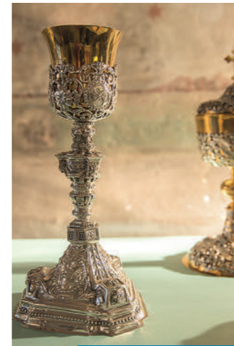
05. Ziborium und Kelch

finden Sie die Gemälde des Dom-Museums. 04 Das beeindruckende Gemälde „Der Schmerzensmann“ von Lukas Cranach d.Ä. zeigt eine lebensgroße Darstellung des gekreuzigten und wiederauferstandenen Christus aus der Zeit der Reformation. Der Raumabschnitt dahinter präsentiert den Wandel des Kreuzigungsmotivs im Laufe der Jahrhunderte.