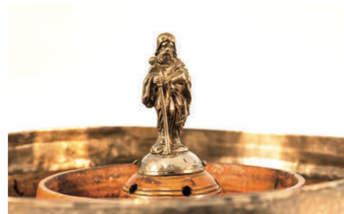
06. Trinkgefäß für heißen Gewürzwein

Mit Altargeräten, 05 katholischen Bibelausgaben und Andachtsbüchern widmet sich eine Vitrine der Geschichte der katholischen Kirche in Bremen, insbesondere der Kirche St. Johann. Eine weitere Wandvitrine stellt das bis heute lebendige Wirken der Domdiakonie sowie die Bremer Jakobusbruderschaft vor. 06 Die wechselvolle Geschichte