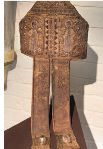
03. Mitra mit Bergkristallen

Ein besonderes Erlebnis erwartet Sie in der ehemaligen Schatzkammer des St. Petri Doms. Hier liegen in gut geschützten Vitrinen die Grabfunde aus acht mittelalterlichen Bischofsgräbern des 11. bis 15. Jahrhunderts: Bischöfliche Insignien (Stab und Ring), mehrere Bischofsmützen (Mitren), Kelche und Hostienteller (Patenen) und verschiedene Einzelteile der Gewänder Bremer Bischöfe. Ein weltweit einzigartiger Schatz an mittelalterlichen Textilien! 03 Von besonderer Bedeutung sind hier einige Stücke aus dem 13. Jahrhundert: Eine bestickte Mitra, ein Gewand mit Vogelmotiven, sowie eine Bischofskrümme aus Emaille mit einer Verkündigungsszene.