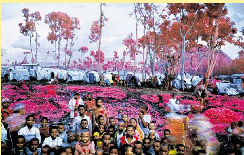
Richard Mosses Fotografie „Lost Fun Zone“.

11 Fotografien von Richard Mosse, Radierungen von Horst Antes, die Intervention „Wer war Milli?“ und die Sammlungsausstellung „Remix“ können in der Kunsthalle betrachtet werden. Dazu: Hör-Bilder des Musik-