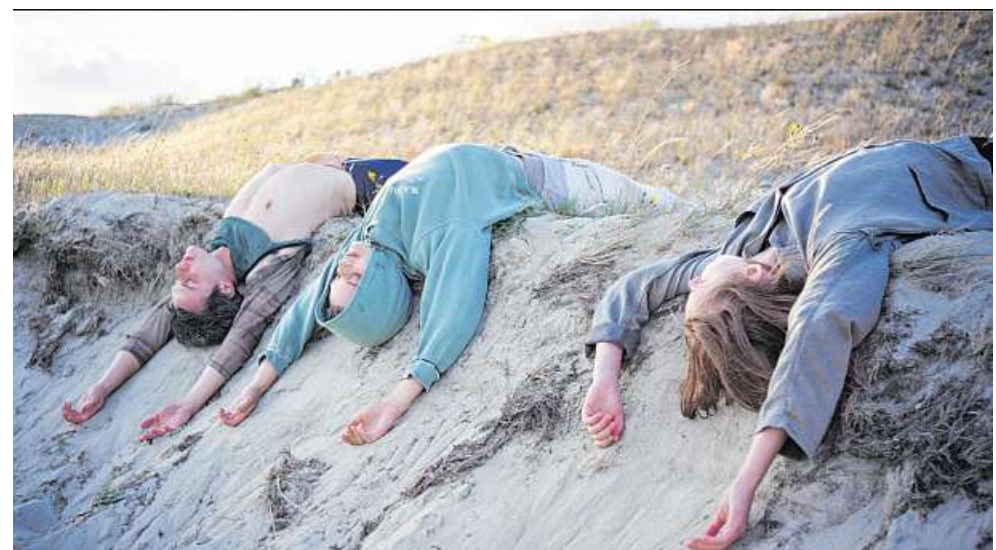
Szene aus dem Film „Songs from the compost“ von Eglé Budvytyté. FOTO: EGLÉ BUDVYTYTÉ

7 In der Gesellschaft für Aktuelle Kunst finden im Rahmen der Ausstellung „Den leeren Strand überqueren, um den Ozean zu sehen“ Lesungen und Kurzführungen statt. Außerdem kündigt die Galerie die „Bar do Amanhã“ (Die Bar von morgen) an, „ein Ort der Extravaganz, wo das Undenkbare ge-