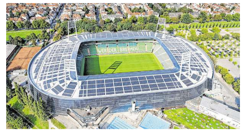
Das Wohninvest Weserstadion von oben. Eine Führung durchs Stadion bei der Langen Nacht der Museen dauert etwa 45 Minuten.

21 Wer schon immer mal auf der Trainerbank im Wohninvest Weserstadion sitzen, durch den Spielertunnel, den Pressebereich und andere spannende Bereiche laufen wollte, zu denen man als Fan normalerweise keinen Zugang hat, der kann sich diesen Wunsch bei einer „Nachtwanderung“ durchs